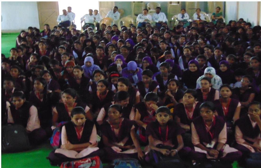
ATTENDED STUDENTS OF CONSTITUTION DAY