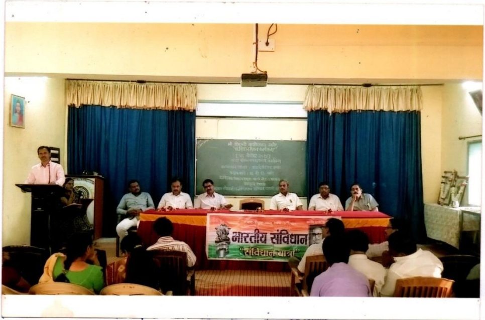
Organized Constitution Day Programme