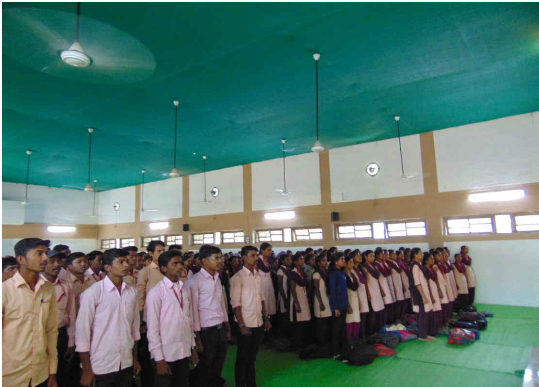
ATTENDED STUDENTS OF CONSTITUTION DAY